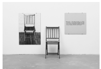
코수스, 「하나, 그리고 세 개의 의자」

쿠넬리스는 주변에서 흔히 볼 수 있는 살아 있는 말 12마리를 화랑 벽에 매어 놓고, 감상자가 화랑이라는 환경 안에 놓인 실제 말들의 존재와 말들의 온기와 냄새, 그리고 소리를 체험해서 다양하게 작품의 의미를 만들도록 하였다.